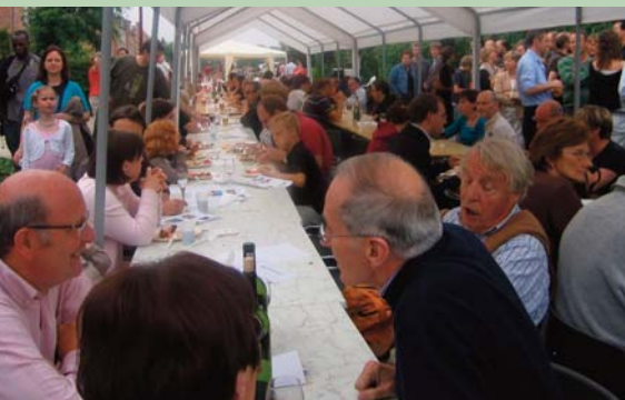
Straatfeest met braai op 9 juni te Kontich